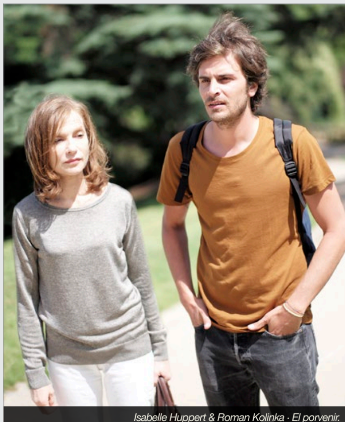
Isabelle Huppert & Roman Kolinka · El porvenir.

2016: Críticos de Los Angeles: Mejor actriz (Huppert).